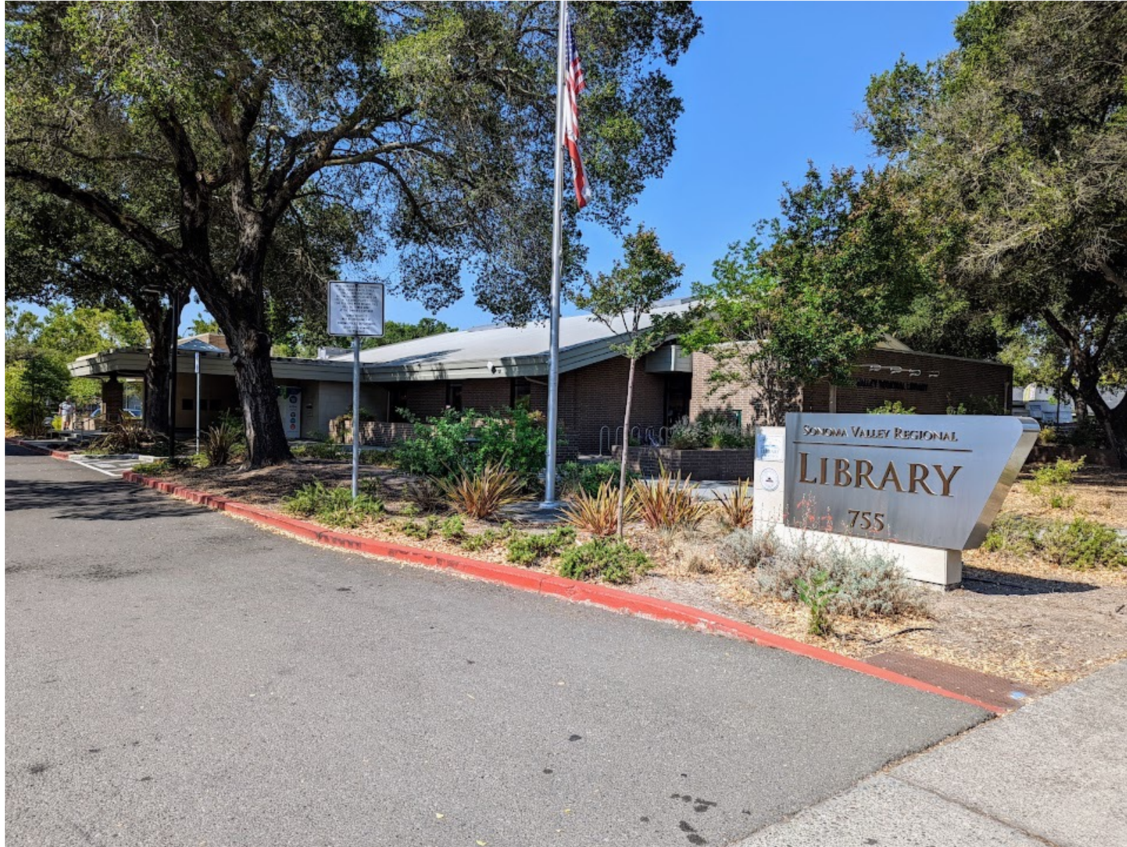
BIBLIOTECA REGIONAL DE SONOMA VALLEY